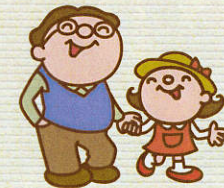
どれにしようかな