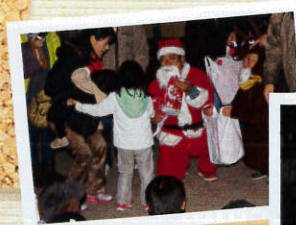
サプライズSBサンタ