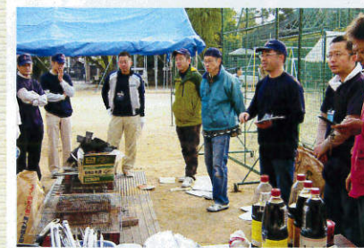
綿密な打ち合わせ