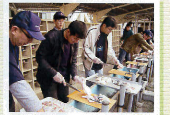
「千賊焼」下ごしらえ