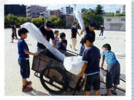
みんなで後片付け