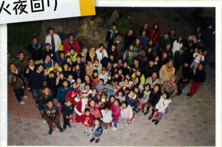
3コースに分かれて防火夜回り