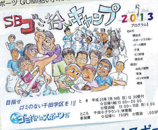
「スポーツ GOMI拾い」ポスター