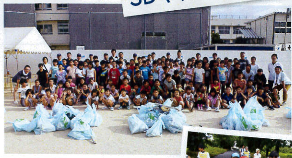
たくさん拾ったよ