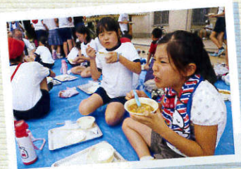
夕食エコロジーカレー