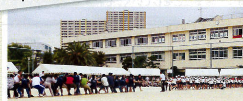
6年生にいい思い出を...「オヤジに挑戦!」(前年度撮影)