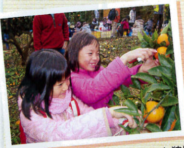
江田島でみかん狩り