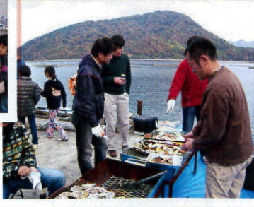
カキ焼きバーベキュー