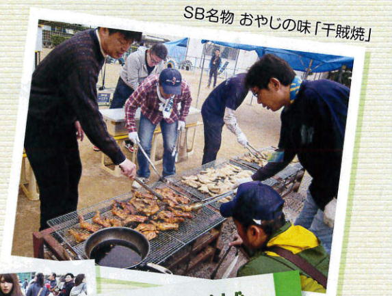
SB名物 おやじの味「千賊焼」